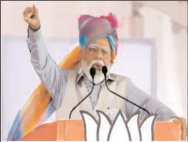
नरेंद्र मोदी (बीजेपी) का मुस्लिम विरोधी राजनीति पर नफरती भाषण

प्रधानमंत्री मोदी ने रविवार, 21 अप्रैल को राजस्थान के बांसवाड़ा में अपने अभियान के दौरान कहा था, 'इससे पहले जब उनकी (यूपीए) सरकार सत्ता में थी, उन्होंने कहा था कि देश की संपत्ति पर पहला अधिकार मुसलमानों का है, जिसका मतलब है कि वे इस संपत्ति को इकट्ठा करेंगे और उन्हें बांट दें- जिनके