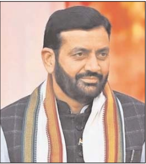
गरीबों के चेहरों पर आई मुस्कान

चंडीगढ़। चुनावी भागदौड़ के बीच मुख्यमंत्री नायब सैनी चंडीगढ़ में संत कबीर कुटिया पर लोगों से मुलाकात भी कर रहे हैं। सोमवार को मुख्यमंत्री से मिलने सरपंच व पाण्डे पहुंचे। उनकी समस्याएं सुनते हुए मुख्यमंत्री ने अधिकारियों को उनकी समस्याओं का तत्काल समाधान करने के निर्देश दिए। मुख्यमंत्री ने कहा कि आमजन के लिए उनके घर के दरवाजे 24 घंटे खुले हैं तथा उनकी समस्याओं के समाधान में किसी भी स्तर पर कोताही बर्दास्त नहीं की जाएगी। डलब इंजन सरकार ने 10 साल में न केवल गांवों का विकास किया है, बल्कि गांवों को 24 घंटे बिजली मिलनी भी शुरू हुई है।