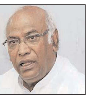
कंपनियों को कमवाया। किसानों के दावों का समय पर भुगतान नहीं करने की सरकार की आलोचना करते उन्होंने कहा

नयी दिल्ली/एजेंसी। कांग्रेस अध्यक्ष मल्लिकार्जुन खडगो ने किसानों से कहा है कि केंद्र में कांग्रेस की सरकार बनने पर किसान हित में जरूरी निर्णय लिए जाएंगे और फसल बीमा की राशि सीधे किसानों के खाते में भेजी जाएगी। खडगो ने कहा कि किसानों के लिए बीमा भुगतान का सीधा ट्रॉफर होगा।