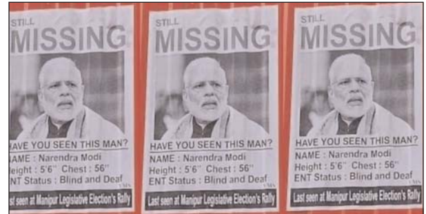
कुछ समय पहले मणिपुर में लगाए गए प्रधानमंत्री नरेंद्र मोदी के 'मिसिंग' पोस्टर.

इसी दौरान पीएम मोदी ने विदेश के भी 14 आधिकारिक दौरे किए, और ये दौरे तब किए अपने पद पर बने हुए हैं और उनके या किसी अन्य मंत्री के खिलाफ कोई कार्रवाई नहीं की गई है। मणिपुर में पीएम की