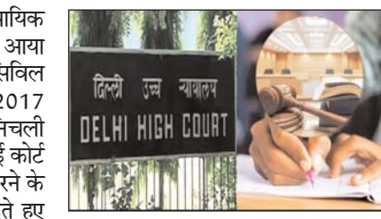
होने पर ही सुनवाई टालने की मांग को मंजूरी दे।

चंडीगढ़/एजेंसी। हरियाणा न्यायिक पेपर लीक मामले में बड़ा अपडेट आया है। दिल्ली हाई कोर्ट ने हरियाणा सिविल सेवा (न्यायिक) प्रारंभिक परीक्षा 2017 के कथित पेपर लीक मामले में निचली अदालत को निर्देश दिए हैं। दिल्ली हाई कोर्ट ने इस मामले में कार्यवाही समाप्त करने के लिए निचली अदालत को निर्देश देते हुए ट्रायल को तीन महीने में खत्म करने को कहा है।